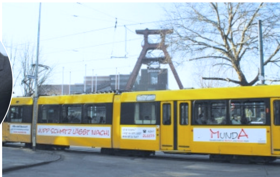
► In Essen wirbt eine Straßenbahn für das Projekt „Jupp Schmitz lässt nach!“

durch eine verbesserte Beleuchtung beheben. „Oder Zugluft und Kältestrahlung werden vermieden“, gibt er weitere Tipps aus der täglichen Praxis. Für Abhilfe bei Schmerzen im Nacken, Schulter- oder Rückenbereich könne bereits ein höhenverstellbarer Schreibtisch sorgen, der die Körperhaltung verbessert und den Sitzarbeitsplatz im Handumdrehen zur Abwechslung in einen Steharbeitsplatz verwandelt.